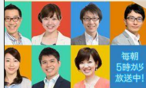
NHKラジオ マイあさラジオ