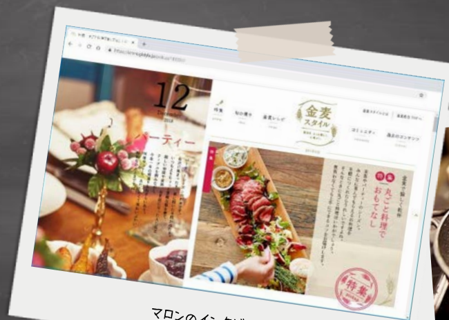
マロンのインタビュー