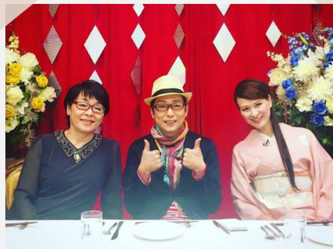
マロン★マジック 審査委員3人で