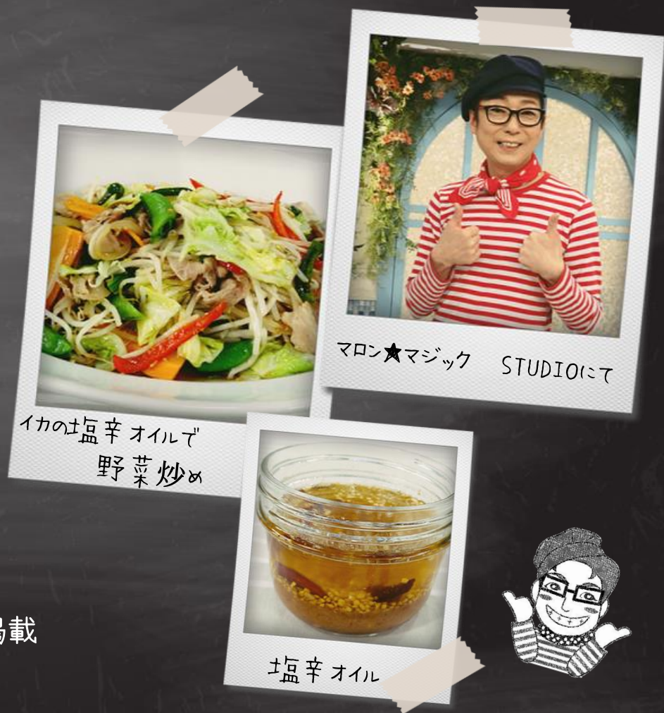
マロン★マジック STUDIOにて