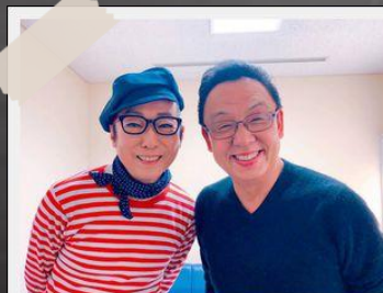
スタジオ収録控室で